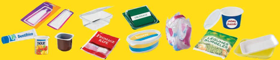
Autres emballages en plastique, pensez à séparer l'opercule ou le film de l'emballage