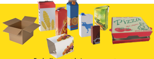
Emballages et briques en carton