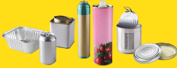
Emballages en métal, couvercles