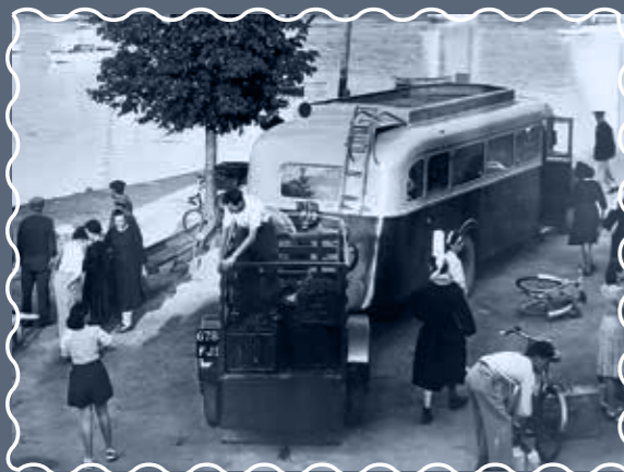
LES CARS "LE MOIGNE" "Le Moigne" buses „Le Moigne“-busse