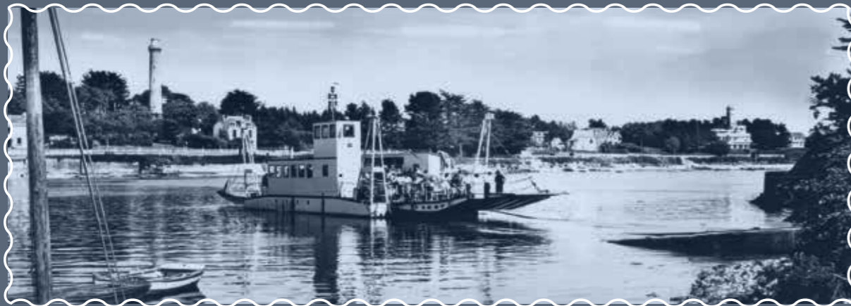
LE BAC BÉNODET, ST-MARINE The Benodet, St-Marine ferry Personenfähre Benodet, Saint-Marine