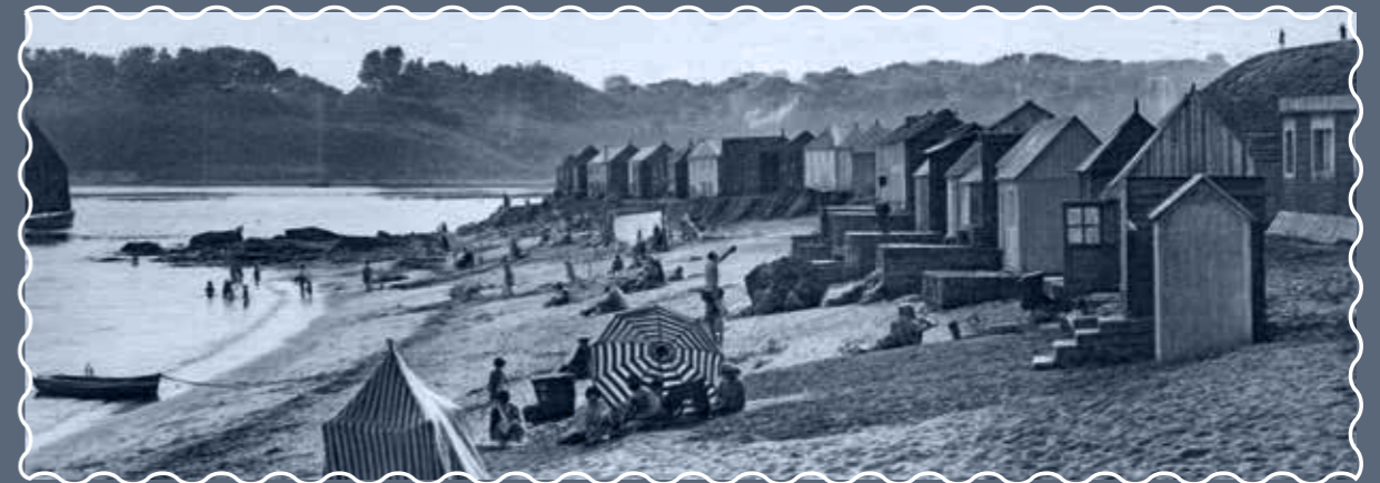
LES CABINES DE BAIN Beach huts Strandkabinen